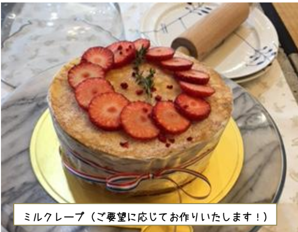
ミルクレープ (ご希望に応じてお作りいたします！)

宇都宮市滝の原1-1-1 TEL028-633-4534 CRÊPERIE 753 (2018.4.1オープン)