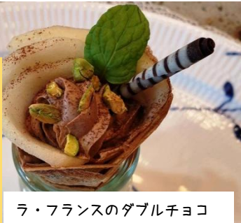
ラ・フランスのダブルチョコ

今年の4月で満3才になりました。大変な時代ですがご愛顧くださり誠にありがとうございます。お菓子作りに魅せられて●ン十年。クレープも、まだまだ奥が深いので興味が尽きません。社会の変化を加速させたコロナですが、何気ない日常により添えるクレープリーを目指しています！