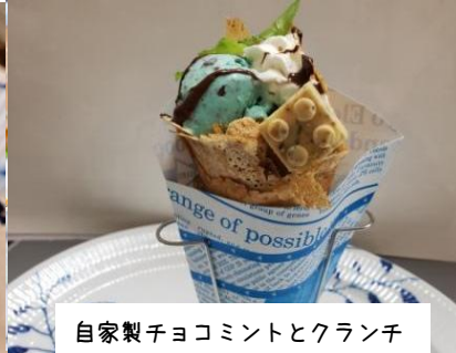
自家製チョコミントとクランチ