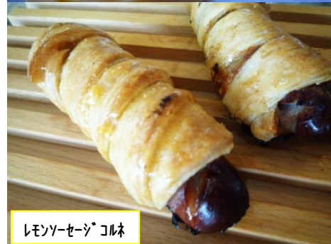
レモン・セージ コルネ