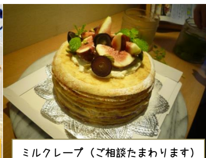
ミルクレープ (ご相談まわります)