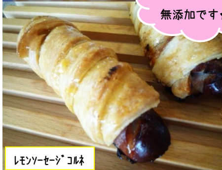
レモンソーゼン コルネ