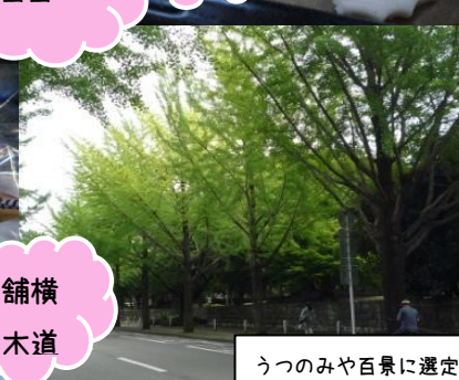
うつのみや百景に選定